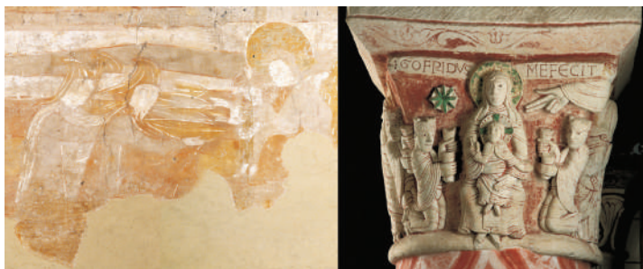
L'Adoration des Mages : détail de la fresque de l'église de Saint-Pierre-les-Églises (gauche) et chapiteau de la collégiale Saint-Pierre (droite).

Musées de Chauvigny : Donjon de Gouzon et musée des Traditions populaires et d'archéologie, Infos : http://chauvigny-patrimoine.fr/ Conservation : 3, rue Saint-Pierre, BP 90064, 86300 Chauvigny, 05 49 46 35 45.